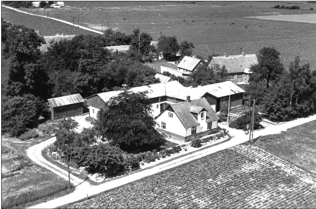
Birkelund - Birkegårdsvej 20 - 1955