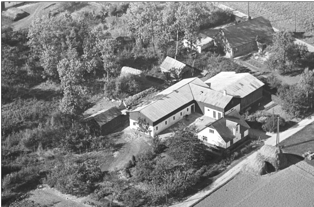
Birkelund - Birkegårdsvej 20 - 1949

Luffotos fra 'Danmark set fra Luften' (Det Kongelige Bibliotek):