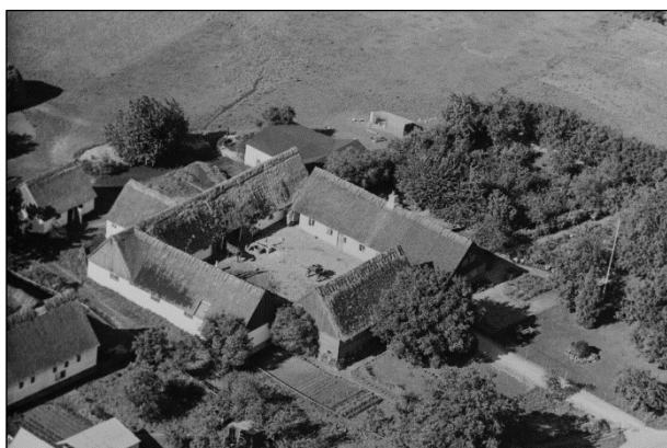
Egebæksgaard - Luffoto 1939

Luffotos fra ' Danmark set fra Luften ' (Det Kongelige Bibliotek):