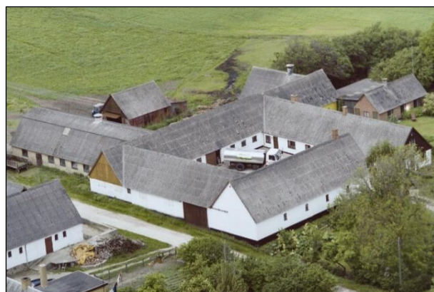
Egebæksgaard - Luffoto 1987