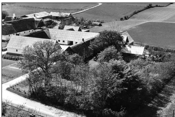
Egebæksgaard - Luffoto 1955