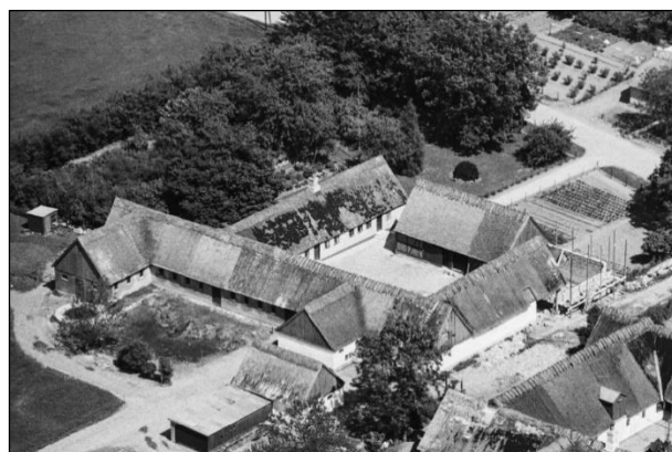
Egebæksgaard - Luffoto 1949