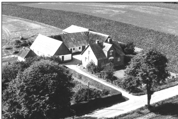
Højstensminde - Luffoto 1961