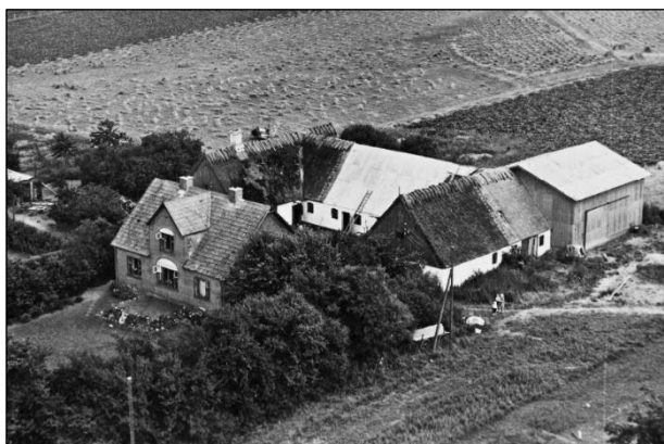
Højstensminde - Luffoto 1951