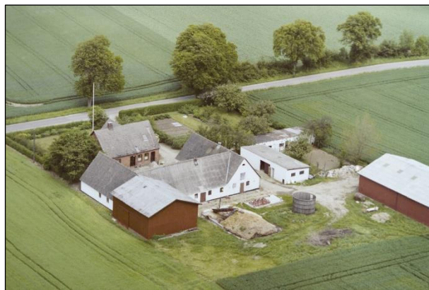
Højstensminde - Luffoto 1987