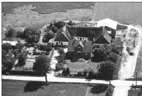
Højstensminde - Luffoto 1949