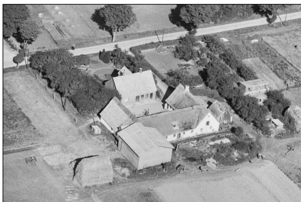
Højstensminde - Luffoto 1939

Luffotos fra 'Danmark set fra Luften' (Det Kongelige Bibliotek):