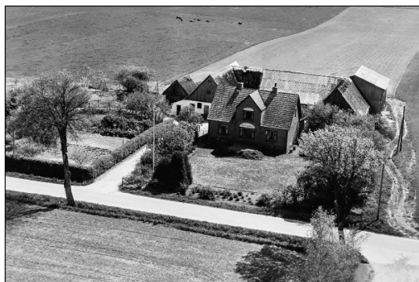
Højstensminde - Luffoto 1955